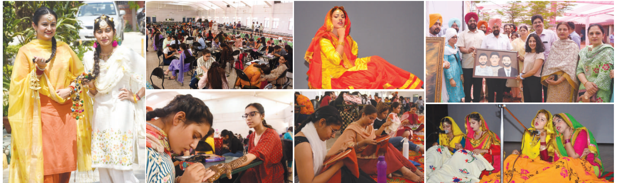
लुधियाना / यूटर्न / 20 अप्रैल। पंजाब एग्रीकल्चर यूनिवर्सिटी में आयोजित विरासती मेले के दौरान छात्र मेहंदी प्रतियोगिता में भाग लेते हुए, कढ़ाई प्रतियोगिता में भाग लेती छात्राएं।