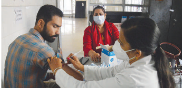
मरीज नहीं है। धीरे-धीरे बढ़ते महेनजर राज्य सरकार, जिला इस खतरे को यहीं रोकने के प्रशासन व सेहत विभाग की

अस्पतालों में भी भर्ती होने वाले संक्रमितों की संख्या बढ़ गई। इनमें से दो मरीजों को तो अस्पताल में दाखिल भी कराना पड़ गया। फिलहाल निजी अस्पतालों में ऐसे चार मरीज दाखिल हैं। वहीं, होम-आइसोलेशन वाले मरीजों की तादाद 17 है। जिले में एक्टिव केस 21 हो चुके हैं। फिलहाल तक राहत की बात यही है कि वेंटिलेटर पर कोई