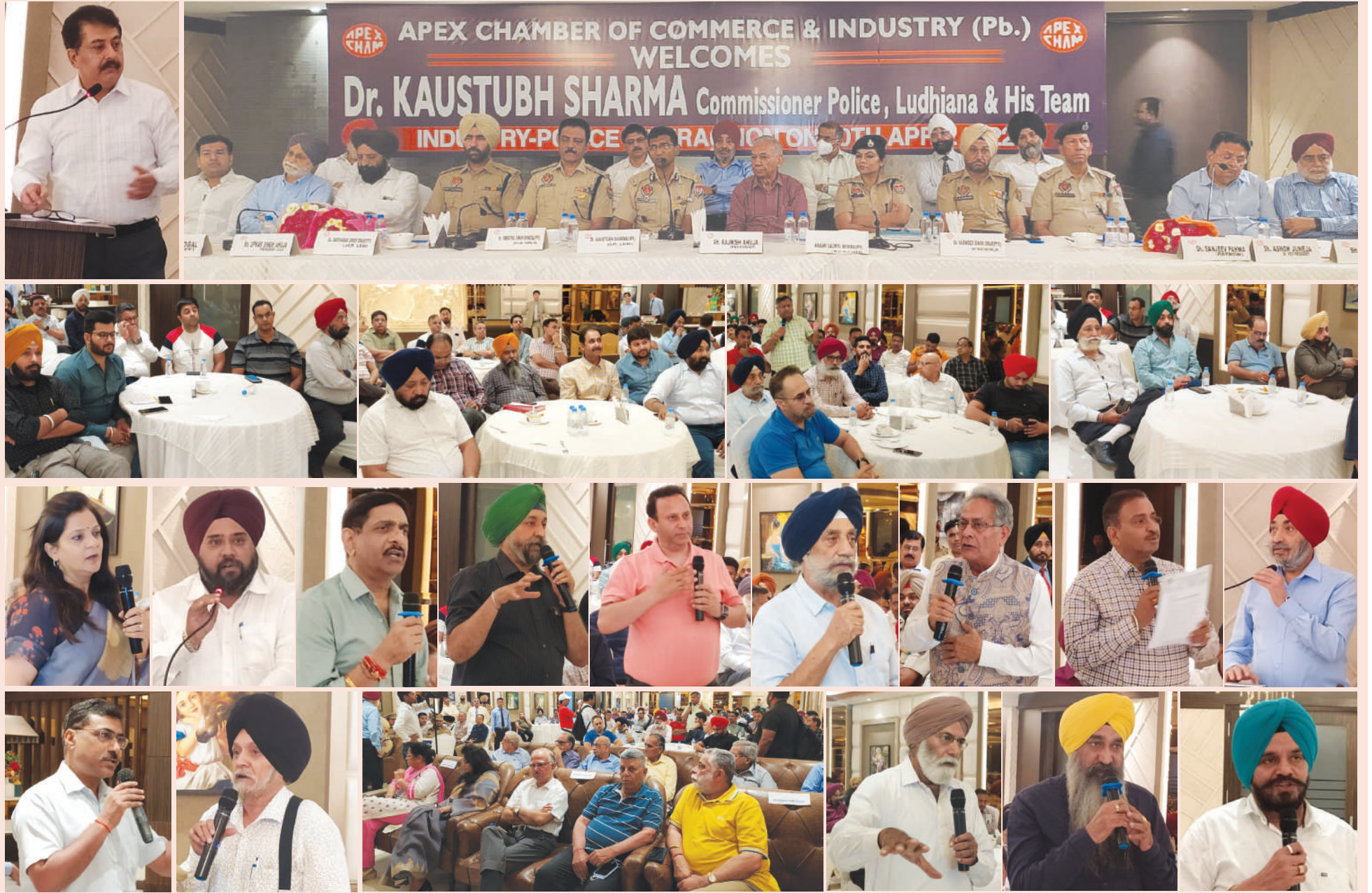
लुधियाना / यूटर्न / 20 अप्रैल। बुधवार को होटल आगाज में महानगर में बिगड़ते लॉ एंड ऑर्डर, इंडस्ट्री से संबंधित विभिन्न समस्याओं और सुझाव को लेकर इंडस्ट्री व पुलिस प्रशासन के बीच इंटरैक्शन मीटिंग का आयोजन किया गया। जिसमें प्रधान रजनीश अहूजा के नेतृत्व में आयोजित मीटिंग में दो दर्जन से ज्यादा उद्योगिक संगठनों के प्रधानों ने पुलिस कमिश्नर कौस्तुभ शर्मा को विभिन्न इंडस्ट्रियल इलाकों की समस्याओं से अवगत करवाते हुए उन्हें हल करने संबंधी सुझाव भी दिये। कमिश्नर शर्मा ने भी कारोबारियों को शहर में अमन-कानून और वर्क फ्रेंडली वातावरण मुहैया करवाने का आश्वासन दिया।