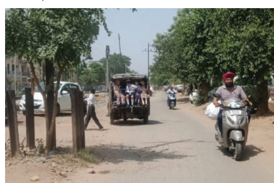
गर्मी में झुलसता बचपन...शहर के धुरी लाइन रोड पर आँटों में लदकर जाते स्कूली बच्चे भीषण गर्मी में बेहाल नजर आए।

लुधियाना / यूटर्न / 20 अप्रैल। इन दिनों गर्मी के कहर का अंदाजा इसी बात से लगा सकते हैं कि कई जगह बुधवार को सुबह करीब साढ़े आठ बजे ही पारा 24-25 डिग्री सेल्सियस पहुंच गया था। जबकि दोपहर में 40 डिग्री से ज्यादा तापमान होने के साथ गर्म हवाएं चलने से लोग बेहाल नजर आए। मौसम विभाग की मानें तो भीषण गर्मी का दौर कल भी जारी रहेगा। बारिश नहीं होने की वजह से लोग झुलसा देने वाली गर्मी में बीमार होने लगे हैं। खासतौर पर स्कूली बच्चों का आते-जाते वक्त बुरा हाल हो रहा है। जबकि नींबू-शिकंजवी, गन्ने के रस, लस्सी वगैरह की दुकानों पर लोग खूब पहुंच रहे हैं, लेकिन इनके इस्तेमाल से भी पूरी तरह राहत नहीं मिल पा रही है।